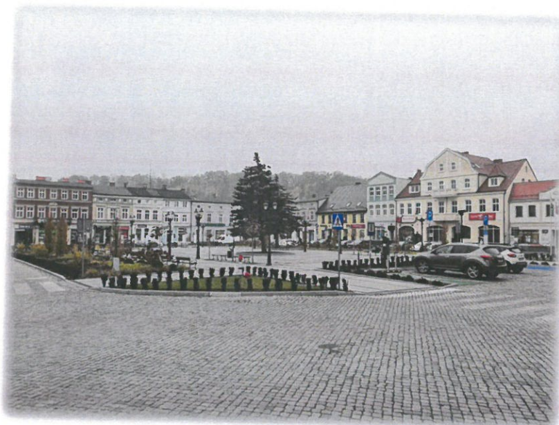
Ryc. 1 Układ urbanistyczny Koronowa – widok na Rynek