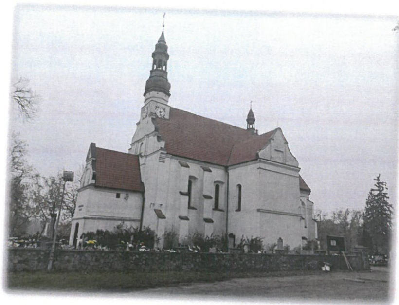
Ryc. 6 Kościół pw. św. Trójcy w Byszewie