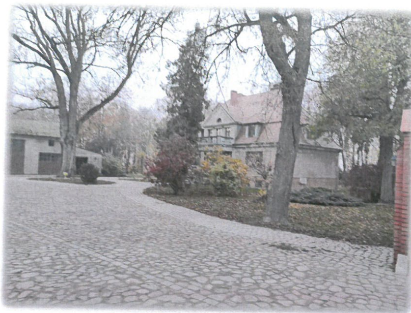
Ryc. 10 Dwór i park w Gościeradzu (Wyczółkowo)

Huta - zespół dworsko-parkowy (wpisany do rejestru zabytków): dwór, park, stajnia i gorzelnia. Dwór z ok. poł. XIX w., eklektyczny, o cechach neogotyckich i neoklasycystycznych: w ryzalicie od frontu szczyt z krenelażem i wieżyczkami w narożnikach. Park krajobrazowy z XIX w., z dwoma stawami i cmentarzem dawnych właścicieli Huty. Budynki folwarczne: stajnia i gorzelnia - ceglane, z 1897 roku.