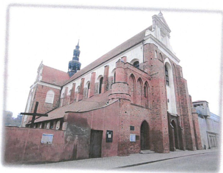
Ryc. 2 Kościół pw. Wniebowzięcia NMP w Koronowie

1289 – 1315, zbarokizowana w koń. XVII i XVIII wieku. Kościół trójnawowy, z zespołem kaplic przy nawach bocznych korpusu, z prezbiterium zamkniętym prostą ścianą. Bogate wnętrze kościoła z gotyckim, gwiaździstym sklepieniem, w nawie głównej barokowe, kolebkowe z lunetami, w nawach bocznych krzyżowe. Kościół posiada bogate, barokowe wyposażenie, w tym obrazy Bartłomieja Strobla i fragmenty polichromii gotyckich. Kościół reprezentuje najwyższy poziom umiejętności cystersów w budownictwie i rzemiośle. Obiekt powstawał etapami, stąd prezentuje trzy style: gotycki, barokowy i rokokowy.