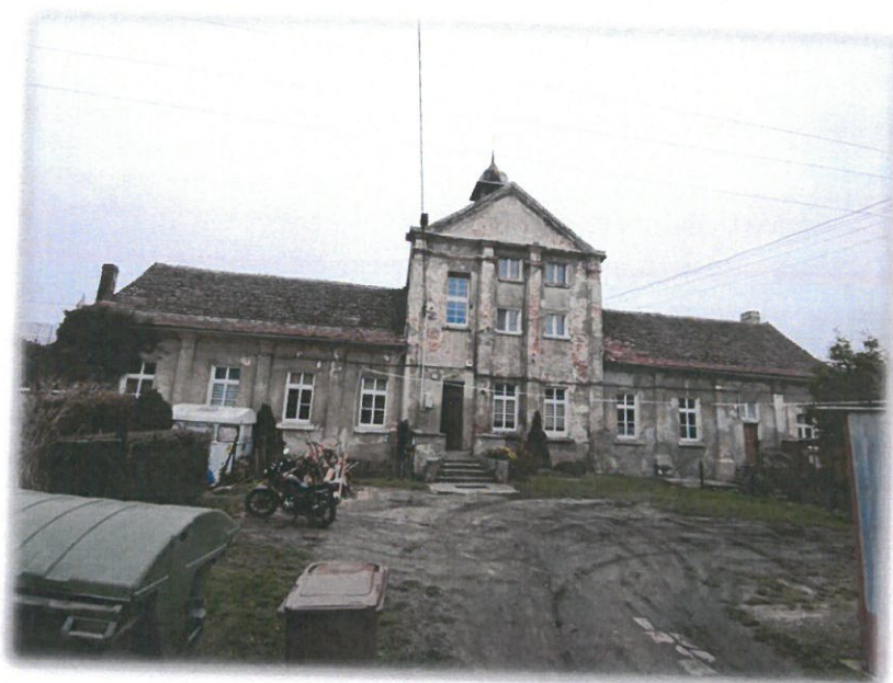
Ryc. 3 Pałac Opata w Koronowie

Kościół filialny pw. Św. Andrzeja zbudowany w latach 1382-1396, w stylu gotyckim, przebudowany w renesansie (1599 r.): wnętrze, szczyty oraz wieżę (obecnie nakryta barokowym hełmem) i baroku (w 1752 r. zniszczone sklepienie wymieniono na drewniane stropy). Kościół posiada barokowo-rokokowe wyposażenie. Świątynia usytuowana jest we wschodniej części starego miasta, na skarpie opadającej ku rynkowi. Teren wokół kościoła to dawny cmentarz z XIV wieku.