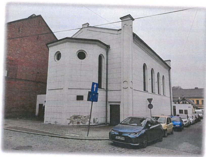
Ryc. 5 Synagoga w Koronowie

Synagoga (ul. Szkolna nr 6), zbudowana w 1856 r. (od 1938 r siedziba Towarzystwa Gimnastycznego „Sokół”). Po II wojnie światowej mieściło się tu kino Brda. W 2000 r. budynek przejęła gmina Koronowo, po wyremontowaniu od 2016 r. działa w nim Centrum Kultury Synagoga.