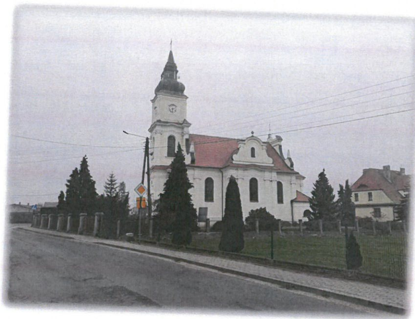
Ryc. 7 Kościół pw. śś. Piotra i Pawła w Wierzhucinie Królewskim

Kościół par. pw. śś. Piotra i Pawła, zbudowany w miejscu wcześniejszego, w latach 1930-31, pseudobarokowy, z rokokowym wystrojem wnętrza. Murowany, otynkowany. W pobliżu kościoła głaz narzutowy (znaleziony w czasie rozbiórki poprzedniej świątyni) z datą 1752 oraz alfą i omegą.