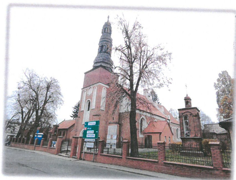
Ryc. 4 Kościół pw. św. Andrzeja w Koronowie

Kościół filialny pw. Św. Andrzeja zbudowany w latach 1382-1396, w stylu gotyckim, przebudowany w renesansie (1599 r.): wnętrze, szczyty oraz wieżę (obecnie nakryta barokowym hełmem) i baroku (w 1752 r. zniszczone sklepienie wymieniono na drewniane stropy). Kościół posiada barokowo-rokokowe wyposażenie. Świątynia usytuowana jest we wschodniej części starego miasta, na skarpie opadającej ku rynkowi. Teren wokół kościoła to dawny cmentarz z XIV wieku.