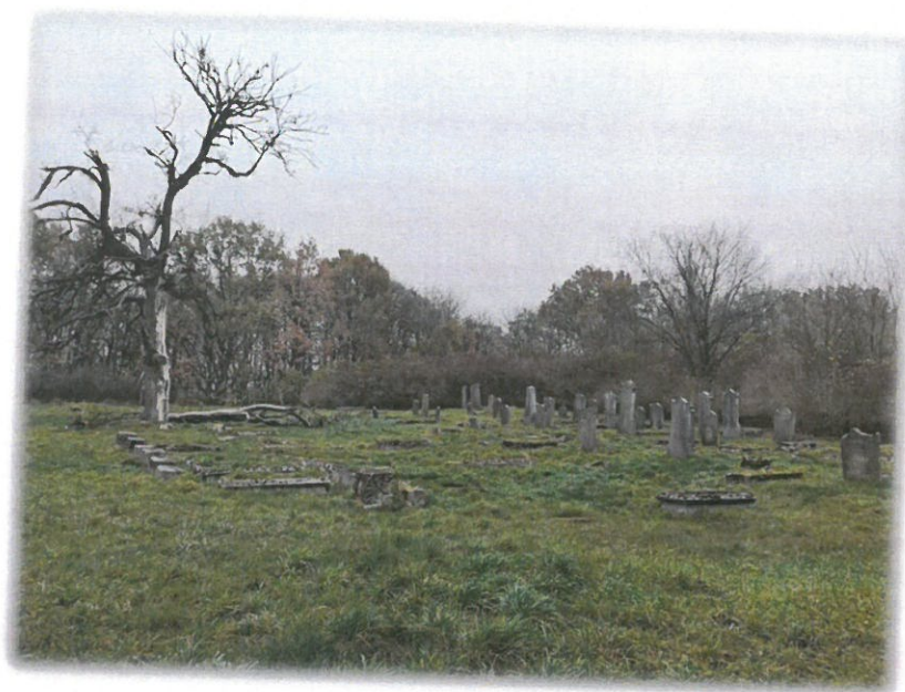
Ryc. 9 Cmentarz żydowski w Koronowie